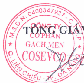
Trần Việt Hạ